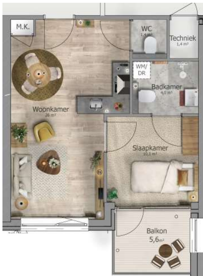
Impressie woning voor alleenstaanden

De woningen voor alleenstaanden hebben een oppervlakte van circa 41 m 2 en de woningen voor echtparen van circa 49 m 2 . Elke woning bestaat uit twee kamers, is gelijkvloers en levensloopbestendig. Het balkon of terras is circa 6 m 2 . De woningen zijn voorzien van een videofoon en bewoners hebben toegang tot de algemene ruimtes met een elektronische tag. Een plattegrond van beide type woningen vindt u in achterin dit informatieboekje.