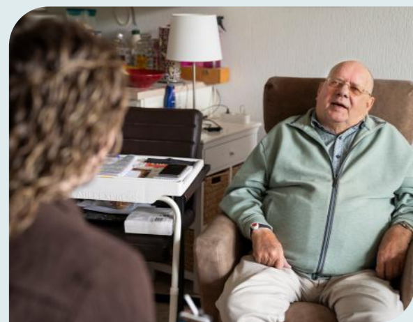
Een veilig gevoel

De tablet is niet alleen medisch, maar ook sociaal een mooi hulpmiddel. Cliënten kunnen online een praatje maken met hun mantelzorgers, met een kleinkind aan de andere kant van de wereld, of Wordfeud spelen met bekenden.