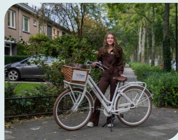
Elke dag op pad

Kirsten: "Natuurlijk blijft de zorg mensenwerk en niet alles kan digitaal, maar het is een geweldige uitkomst om kwetsbare mensen de zorg te blijven geven die ze nodig hebben." ●