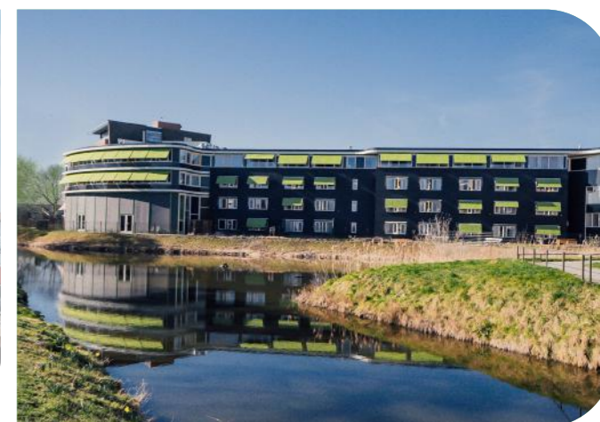
De Tweemaster, Maassluis