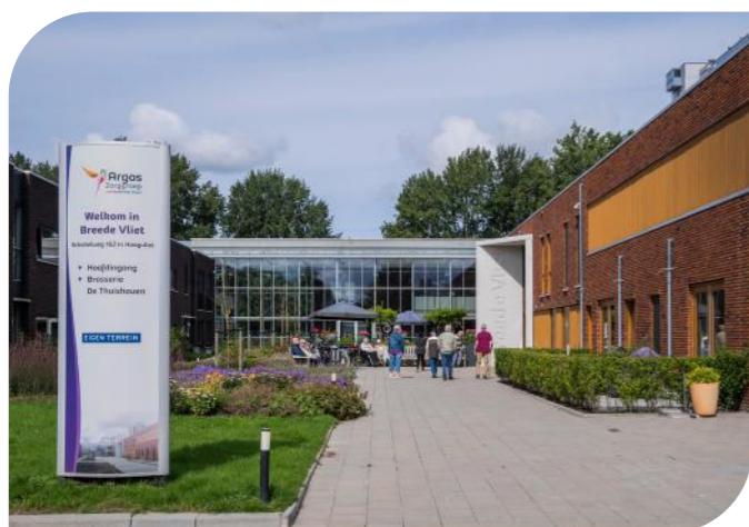
Breede Vliet, Hoogvliet