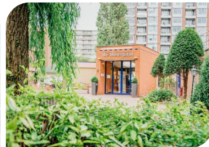
De Meerpaal, Vlaardingen