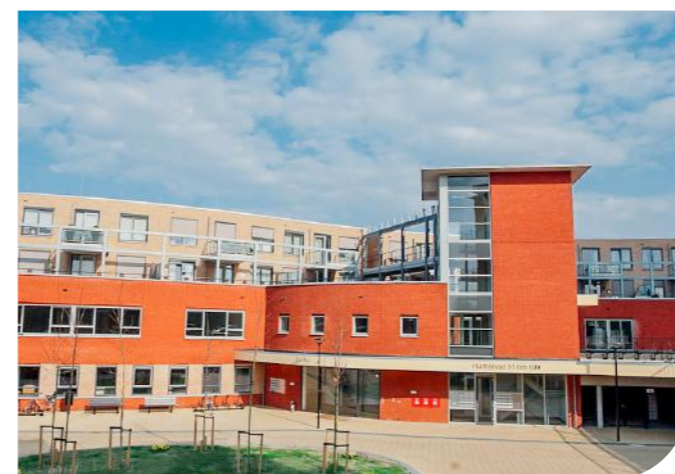
De Es, Spijkenisse