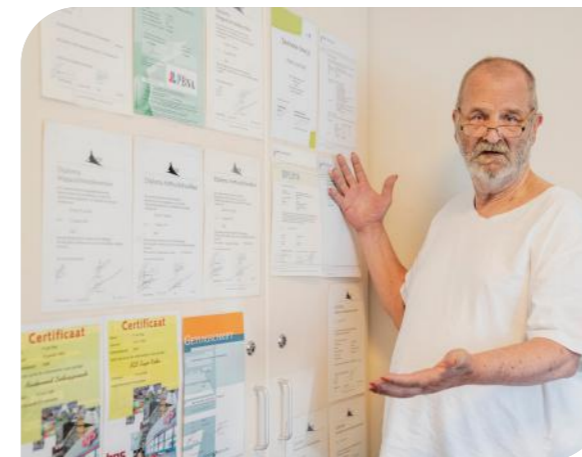
'Ik ben een geleerde meneer'